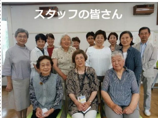
スタッフの皆さん

”サロンほおずき”は平成22年7月、参加者はサクラを入れて8名、スタッフ12名で始まりました。現在まで30名程の参加者の皆さんが入り替りましたが、何事もなく(今年3月から新型コロナウイルス感染拡大防止のため6月まで休会)10年を迎えることが出来ました。南町内会の皆様には日頃より暖かいご支援をいただき、心より感謝申し上げます。